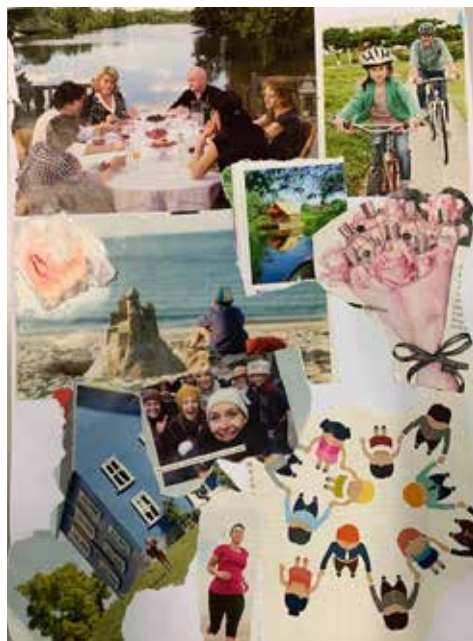
Collages réalisés par les participants